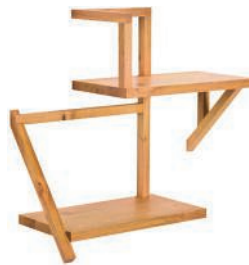
Étagères en chêne. Oak shelves. L76 × 133 × h 80 cm, design Taidgh O'Neill, Taidgh Shelf B & A , ClassiCon GmbH.