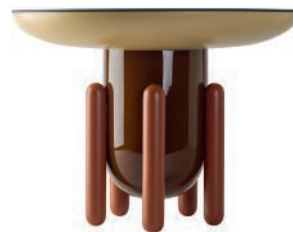
Table en fibre de verre et bois laqué. Fiberglass and lacquered wood table. ø 60 x h 46 cm, design Jaime Hayón, Explorer , BD Barcelona.