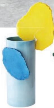
Vase en céramique. Ceramic vase. Dimensions diverses, design Ronan & Erwan Bouroullec, Découpage, Vitra.