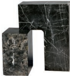
Table d'appoint en marbre. Marble side table. 155 x l 24 x h 48 cm, Found II , A Space.