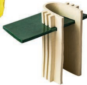
Table d'appoint en grès émaillé. Enameled stoneware side table. L 60 x I 30 x h 50 cm, Bunker, Floris Wubben.