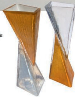
Vases en verre. Glass vases. 10 x 10 x h 28 cm, Tessellation , Bianco Light & Space .