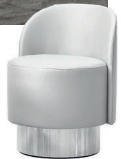
Fauteuil en cuir et aluminium. Leather and aluminum chair. 157 × h73 × p 55 cm, design Studiopepe, Pastilles , Tacchini.