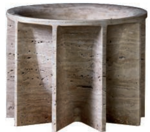
Coupe en travertin. Travertine bowl. À partir de ø 25 x h 20 cm, design Grégoire de Lafforest, Ray , Collection Particulière.