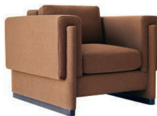
Fauteuil en tissu et noyer. Fabric and walnut armchair. l 101 x h 81 x p 105 cm, Howard, Egg Collective.