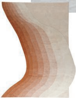
Tapis en coton et laine d'Himalaya. Himalayan wool and cotton rug. L 300 x I 230 cm, design Germans Ermicš, Tidal, cc-tapis.

Side table and coffee table (against the wall) resulting from a collaboration between Giancarlo Valle and the American brand Viso.