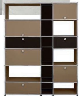
Bibliothèque en acier. Steel bookshelf. L 154 x l 39 x h 194 cm, design Fritz Haller, USM.