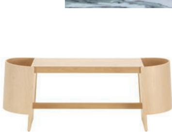
Banc à rangements en bouleau. Birch storage bench. 118 × 136 × h 45 cm, design Koichi Futatsumata, Kiulu, Artek.

— Âme oak floor lamp and accessories by Christophe Delcourt (Delcourt Collection).