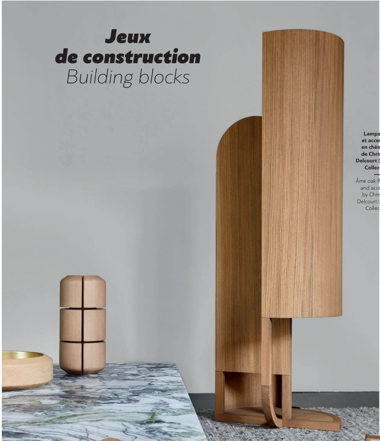
Lampadaire et accessoires en chêne Âme de Christophe Delcourt (Delcourt Collection).

— Âme oak floor lamp and accessories by Christophe Delcourt (Delcourt Collection).