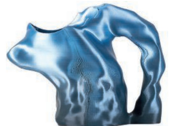
Carafe imprimée en 3D en acide polylactique. 3D-printed polylactic acid carafe. L 23 x l 10 x h 18 cm, design Audrey Large, TP-TS-1 moccas , Nilufar .