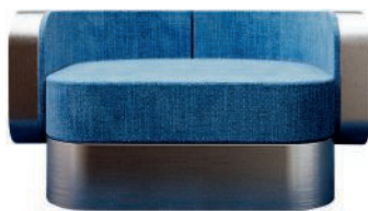
Fauteuil en inox tapissé de velours. Velvet-upholstered steel armchair. l 115 x h 70 x p 110 cm, collection Odyssey, Apollo, Joris Poggioli .