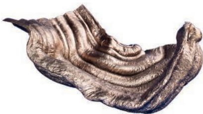
Coupe sculpturale en bronze. Sculptural bronze bowl. Tailles diverses, vue à l'exposition L'Ultima Cera , Anton Alvarez .