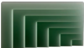
Console en résine époxy. Epoxy resin console. L 154 x l 35 x h 85 cm, GSD, Niko Koronis.

Silk and ceramic sculptures by Ursula Nistrup, Linda Weimann and Anna Havskov.