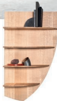
Étagère murale en chêne. Oak wall shelf. I 72 x h 188 cm, design Destroyers/Builders, Étage, Valerie Objects.