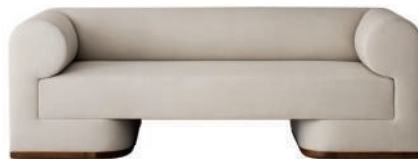
Canapé en chêne tapissé de laine. Wool-upholstered oak sofa. L218 × l89 × h 74 cm, Dahlem , Dmitriy & Co.