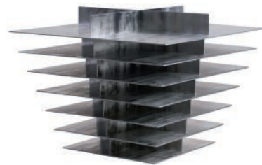
Sculpture-table en aluminium. Aluminum sculpture-table. 75 x 75 x h 56 cm, design Bram Vanderbeke & Wendy Andreu, Art. 5956, Nilufar .