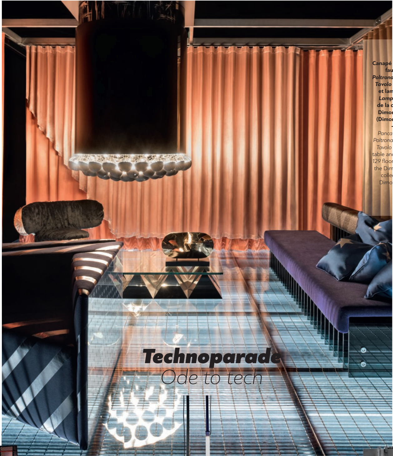
Canapé Panca 139 , fauteuils Poltrona 132 , table Tavolo Basso 131 et lampadaire Lampada 129 de la collection Dimoremilano (Dimorestudio) .

Panca 139 sofa, Poltrona 132 chairs, Tavolo Basso 131 table and Lampada 129 floor lamp from the Dimoremilano collection by Dimorestudio .