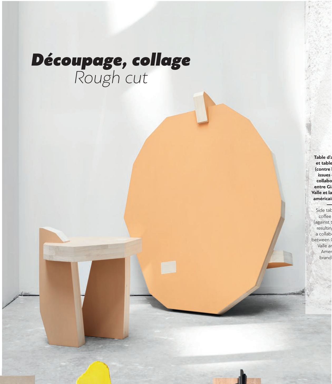
Table d'appoint et table basse (contre le mur) issues d'une collaboration entre Giancarlo Valle et la marque américaine Viso.

Side table and coffee table (against the wall) resulting from a collaboration between Giancarlo Valle and the American brand Viso.