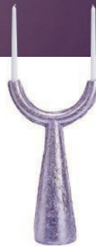
Bougeoir en aluminium pressé. Pressed aluminum candle holder. 12 x 12 x h 48 cm, design Ward Wijnant, Chunk , Oddness .