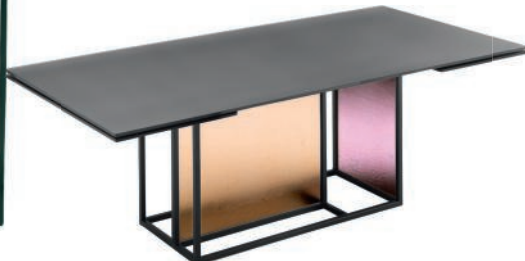
Table en métal et verre. Metal and glass table. L 200 x l 100 x h 75 cm, design Simone Bonanni, Theo , Fiam Italia .