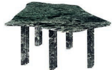
Table en marbre. Marble table. L 180 x I 150 x h 73 cm, No-Thing, Studio Binocle.