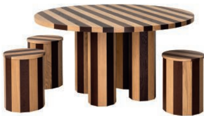
Table et tabourets en chêne. Oak table and stools. ø 144 x h 74 cm, Cooperage, Fort Standard.

ExCinere shelves, column and wall in volcanic ash-glazed tile by Formafantasma (Dzek).