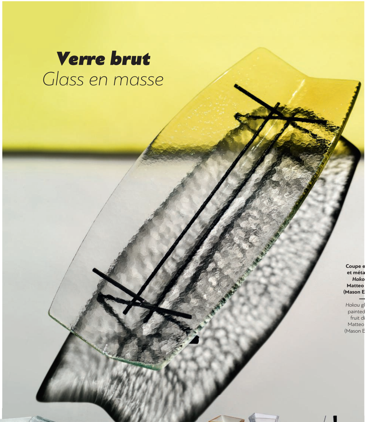
Coupe en verre et métal peint Hakou de Matteo Fiorini (Mason Editions).

Hakou glass and painted metal fruit dish by Matteo Fiorini (Mason Editions).