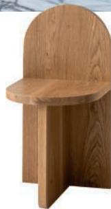
Chaise en chêne, frêne et noyer. Oak, ash and walnut chair. 138 × h 76 × p 40 cm, design Gregory Buntain, Fort Standard.