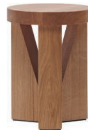
Tabouret en chêne. Oak stool. ø 33 × h 45 cm, design Konstantin Grcic, Cugino , Mattiazzi.