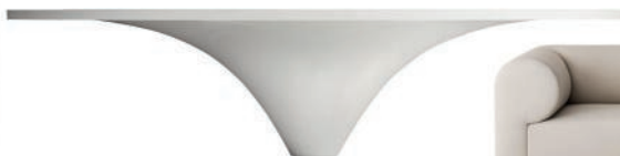
Table en matériaux composite et fibres de bois. Composite and wood fiber table. L250 × h 73 cm, design Piero Lissoni, French Concession , DePadova.