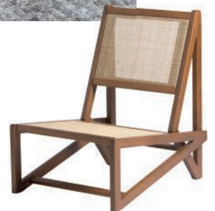
Fauteuil bas en rotin et teck. Rattan and teak low chair. 161 × h 83 × 175 cm, design Studio Adónde, TI , Kann.