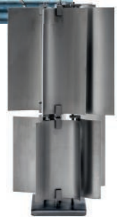
Lampe à poser en métal. Metal table lamp. 30 x 30 x h 60 cm, design Hannes Peer, Petali, Sem .