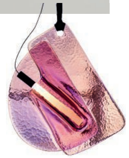
Suspension en verre. Glass pendant lamp. L 50 x l 8 x h 60 cm, Dune , Zaven x WonderGlass .