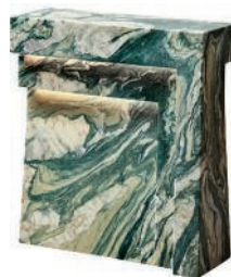
Lampe en marbre. Marble lamp. L 40 x l 15 x h 45 cm, design Humbert & Poyet, Structure I , The Invisible Collection.