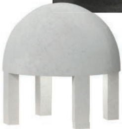
Lampe en plâtre et laiton. Plaster and brass lamp. ø 30 × h 30 cm, design Emmanuelle Simon, Jellyfish , Theoreme Editions.